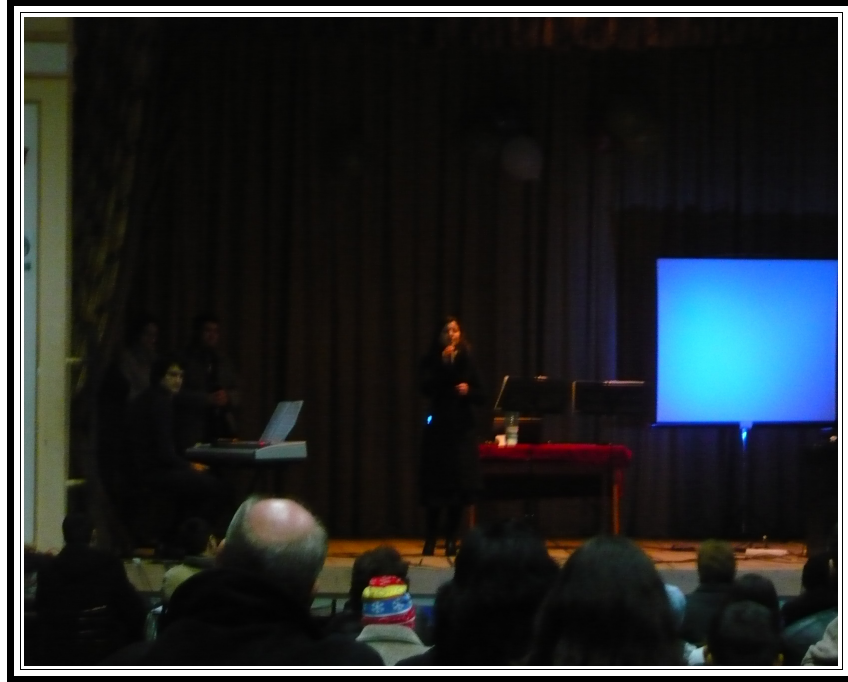
Evoluție solo a sopranei Luiza Spiridon